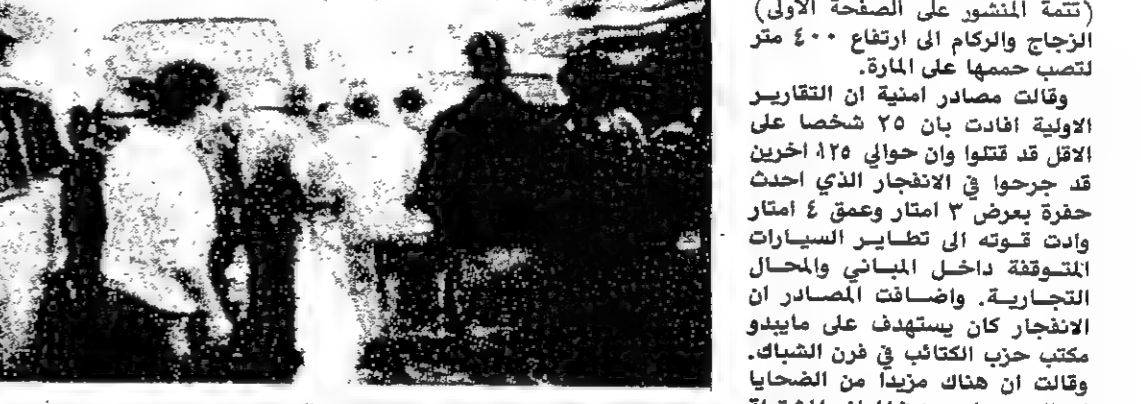
عمليات الاطفاء والانقاذ في فرن الشباك

كانت لاتزال مشتعلة في عشرات من المحال التجارية الواقعة على جانبي الطريق في منطقة الانفجار بعد ساعة من وقوعه. وقال مسؤول في حزب الكتائب ان ليس لديه شك في ان الانفجار «هو» انتقامي على سياساتنا.. ان هذه مجرد رسالة.. ويجب ان نتوقع المزيد». لكن المسؤول الكاثولي الذي اصيب بجروح طفيفة في الحادث رفض توجيه اتهام الى اية جهة محددة.